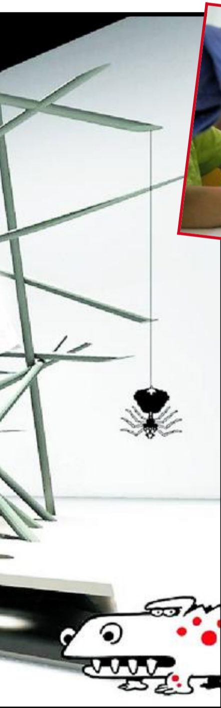
skapt ideer med barna i grenseland ILLUSTRASJON: Griff Arkitektur as.

dal i Griff Arkitektur opplever etter samarbeidet med ni-åringene ved Cicignon skole at arkitektene selv har fått faglig påfyll: