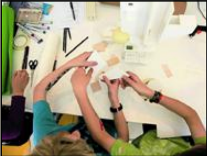
BYGGER SAMMEN: Barnhender bygger fremtiden sammen.

– I Vestfold har man holdt på med barns medvirkning i over 30 år. Nå ser de resultatene. Barns interesser skal med i alle saker på lik linje med kulturminner, landskapsinteresser og så videre.